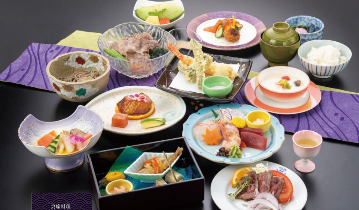
会席料理 もてなし

四十九日や一周忌などのご法要の席を特別なお料理でおもてなしいたします。 ※季節によりお膳の内容は異なる場合がございます。