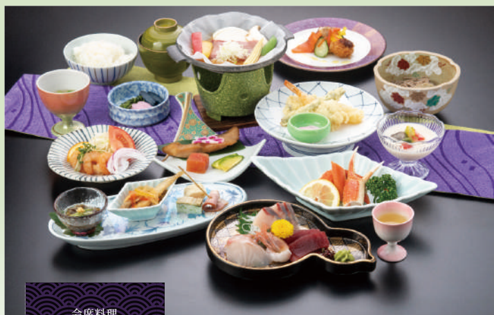
会席料理 あじわい